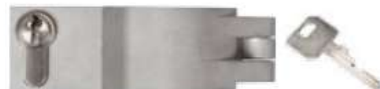
4190 TS TOTAL SECURITY

DESIGNED AND MANUFACTURED IN ITALY. / PROGETTATO E FABBRICATO IN ITALIA.