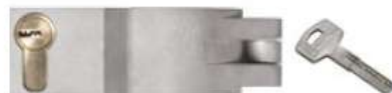
4190 R RADIAL